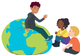
We hebben oor voor elkaar

Vanaf de herfstvakantie werken we vanuit het boekje ‘God’. Dat is weer een boekje uit ons archief. “God als onderwerp om les over te geven, kan dat eigenlijk wel? Voor bijna iedereen is dat even schrikken. God is groot, heilig en onbegrijpelijk. En voor anderen ook zo verbonden met negatieve ervaringen en strenge beelden, dat het maar de vraag is hoe je God aan kinderen uitlegt. Het begin van het antwoord is dat je God niet kunt uitleggen. Maar je kunt wel heel goed met kinderen vragen, voelen, bedenken en ervaren wat God misschien voor je kan betekenen. Kinderen staan daar open voor, soms veel meer dan je als volwassene denkt.”