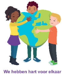
We hebben hart voor elkaar

In januari starten we met het blok “Wij hebben hart voor elkaar”. Gevoelens staan hierin centraal. De Vreedzame School streeft naar een klimaat waarin iedereen zich prettig voelt en waarin kinderen ‘hart voor elkaar’ hebben. Daarmee bedoelt De Vreedzame School dat kinderen respectvol met elkaar omgaan. Dat gaat makkelijker als kinderen in staat zijn hun gevoelens te benoemen en zich in de gevoelens van anderen kunnen verplaatsen. Hierdoor ben je ook beter in staat om conflicten positief op te lossen.